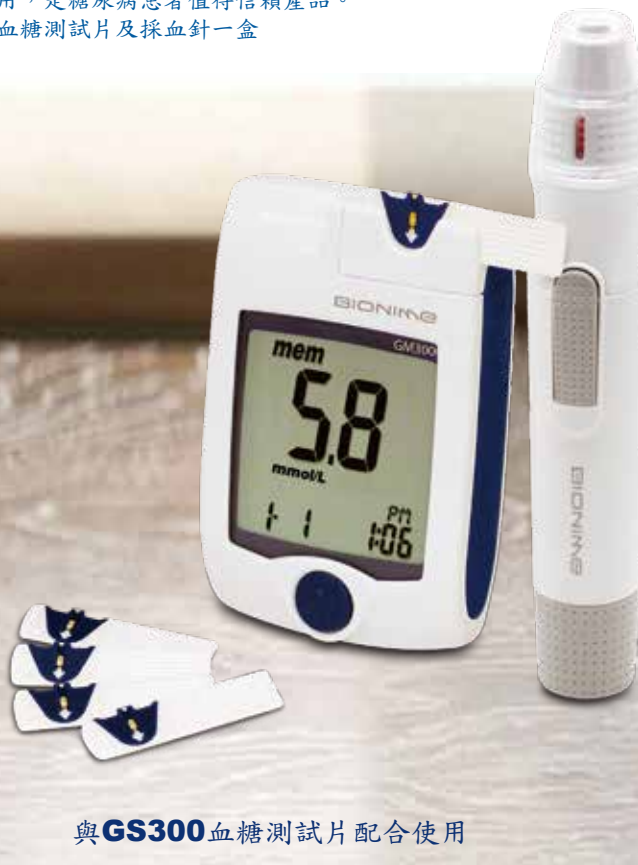
與GS300血糖測試片配合使用

GM300血糖監測系統，結合世界專利的黃金血糖測試片使用，可以精確檢測病患血糖濃度。本產品特點乃是安全、方便、貼心與容易使用，是糖尿病患者值得信賴產品。套裝附血糖測試片及採血針一盒