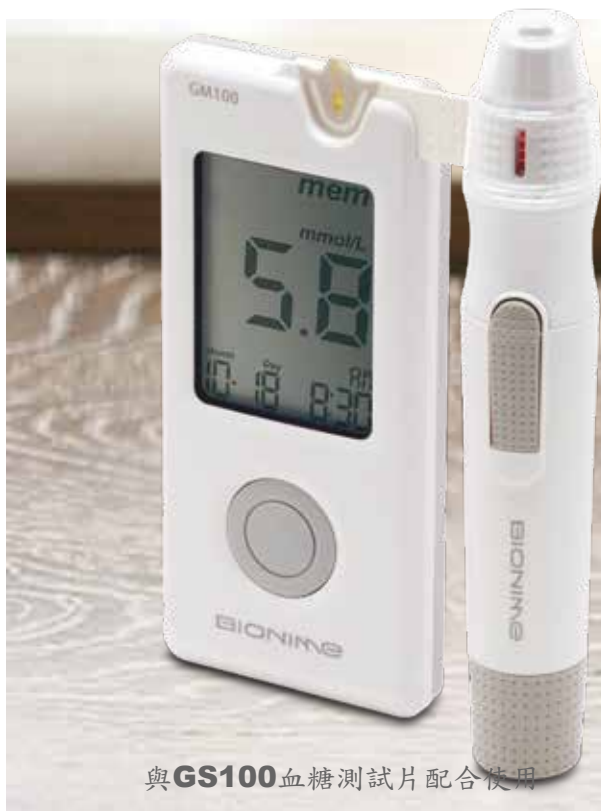
與GS100血糖測試片配合使用

瑞特血糖監測系統GM100系列提供自我檢測及專業測試用，無需校正碼可提升操作的便利性，且時尚輕薄的外型，廣受歐美市場之好評。此系統專供測試指尖，手掌或前臂之血樣檢測。套裝附血糖測試片及採血針一盒